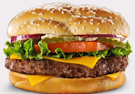
GRILLED BEEF BURGER